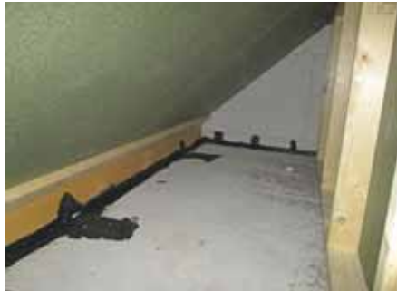
Verwerking van het product vastleggen door middel van foto's en keurlijsten. Deze bewijslast wordt toegevoegd aan het opleverdossier.

Een onderdeel van het handboek is de nulmeting. Deze nulmeting geeft inzicht in waar de desbetreffende organisatie staat en wat de actiepunten zijn. De uitkomsten van de nulmeting resulteren in een gericht actieplan. Het handboek en de bijbehorende nulmeting zijn niet alleen gericht op producten, maar richten zich ook op de processen en de personen die werkzaam zijn binnen het bouwproces. Afgelopen jaar is de vraag naar het uitvoeren van een nulmeting steeds actueler geworden. Leveranciers en producenten willen graag weten op welke wijze zij hun organisatie kunnen voorbereiden op (de Wet) kwaliteitsborging. De nulmeting is juist geschikt voor leveranciers