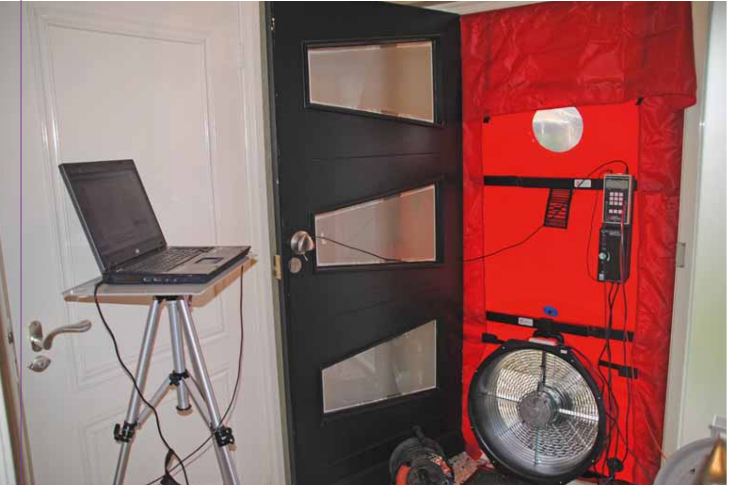
Blowerdoortest om luchtdichtheid te meten.